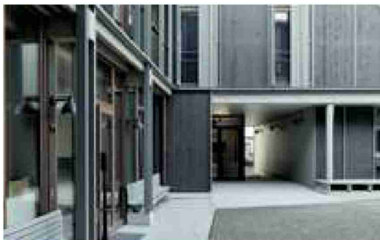
L'or pour le lotissement Maingasse, à Bâle.