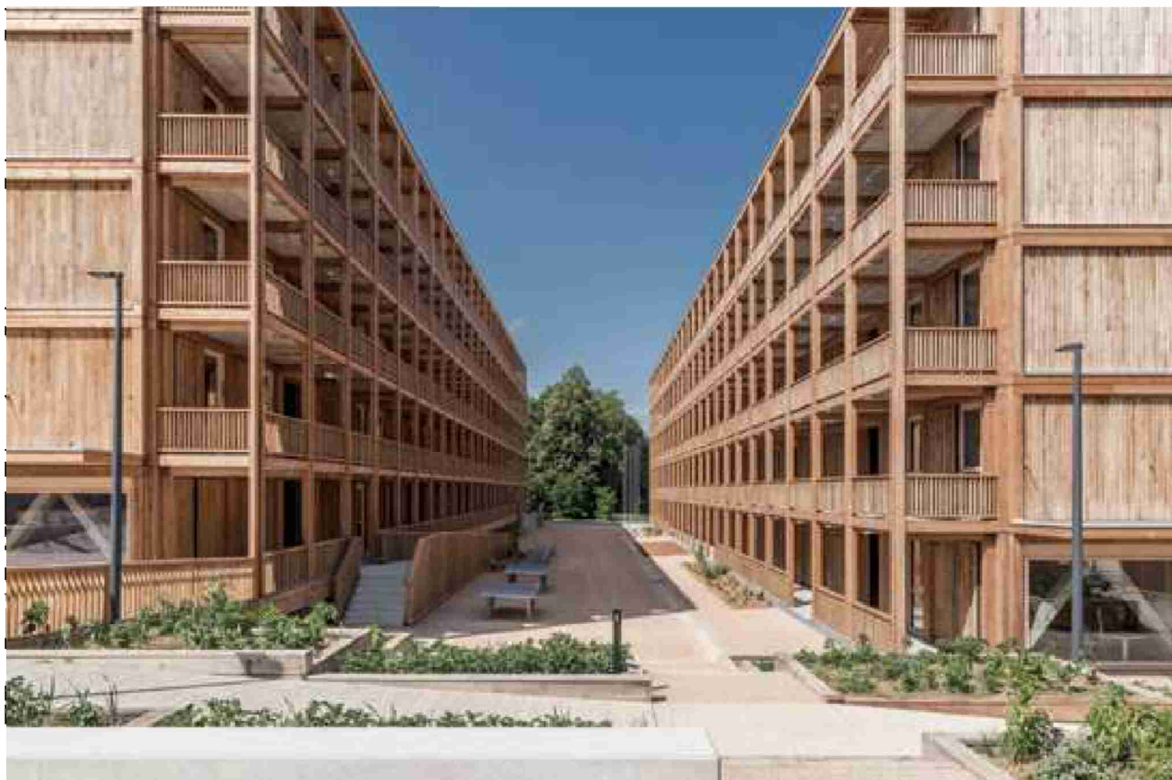
1 er prix romand, Centre d'hébergement collectif de Rigot, avenue de France.