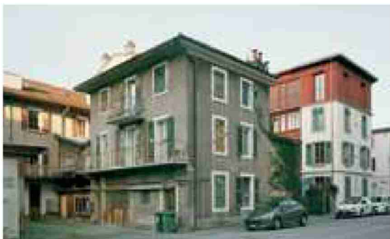
Surélévation à Vevey, Bronze national.